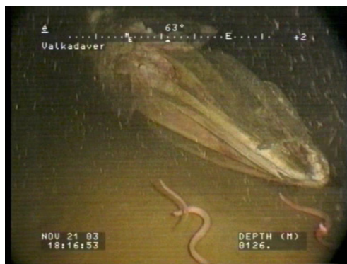
Pirålar vid valens skalle ca 1,5 månader efter sänkningen.