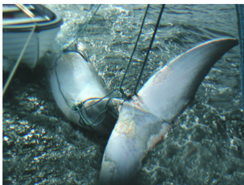
Vikvalen bogserades till Tjärnö Marinbiologiska Laboratorium