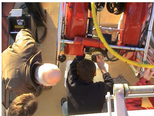
Skelettdelar har plockats upp med ROV:en.

Beräkningar som grundar sig på populationsstorlekar av olika valarter visar att avstånden mellan döda valar på havsbotten inte behöver vara oöverstigliga för larvernas spridning. Det bekräftas också av våra genetiska undersökningar av 19 av de 50 individer som