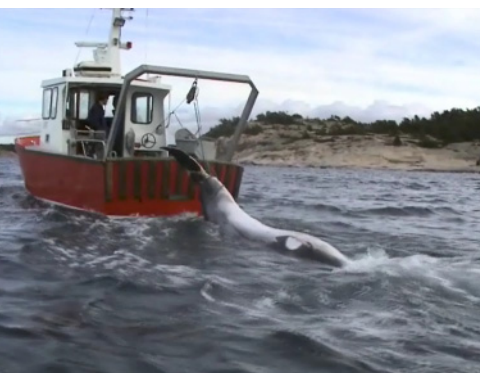
Vikvalen tillhör familjen fenvalar och känns igen på det vita bandet på bröstfenorna

En järnvägsräls som var något kortare än valen visade sig tillräcklig för att få valen att sjunka och allt hängdes bakom laboratoriets forskningsfartyg Nereus. En sista, om än mindre trevlig, provtagning av eventuella parasiter i valens mage utfördes under tillresta mediers överinseende. Solen sken och båten var full av studenter när vikvalen bogserades ut och placerades på 125 meters djup i Kosterfjorden.