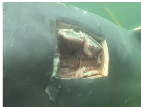
Vävnadsprover och DNA-prover togs åt Naturhistoriska Riksmuseet