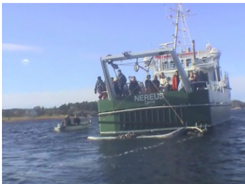
Valen bogseras ut för att sänkas under överinseende av biologistudenter

Hydrotermala källor finns på havsbotten i områden där jordskorpan spricker upp mellan två tektoniska plattor. Ur sprickorna i havsbotten strömmar mycket varmt (350–400°C) och mineralrikt vatten upp, och när detta avkyls i kontakt med det kalla havsvattnet fälls mineralerna ut och det bildas skorstensliknande formationer runt det utströmmande vattnet, s.k. black smokers (där kemikalierna i det varma vattnet ger det ett svart, rökliknande utseende) eller white smokers (där vattnet innehåller andra kemikalier som ger det en vit färg). Upptäckten av hydrotermala källor 1977