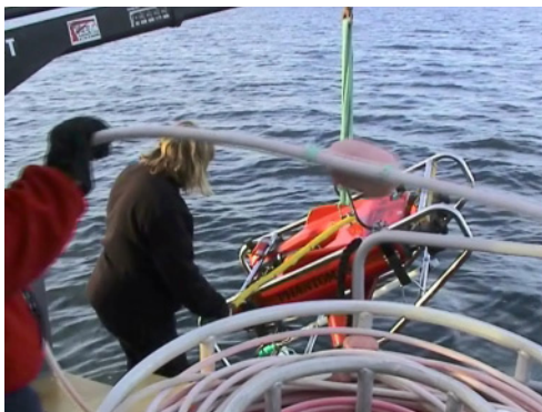
En ROV sjösätts för en dykning till valen.