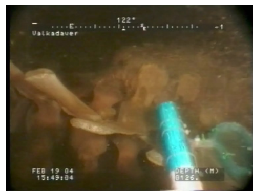
I februari 2004 var stora delar av skelettet rena från mjukdelar.