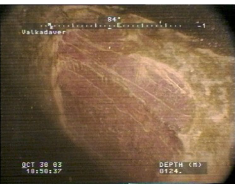
Stora urgröpningsar i valkadavret ca 2 veckor efter sänkningen – är detta hajbett?

Finns benätaren i Atlanten? Förutom fynden av en snäcka och en mussla på ben som trålats upp i Nordatlanten, baseras vår kunskap om valkadaver på naturligt sjunkna eller avsiktligt sänkta valar i Stilla havet. När vi sänkte vår val kunde vi bara hoppas att vi skulle få besök av valkadaverspecialister. En osäkerhetsfaktor